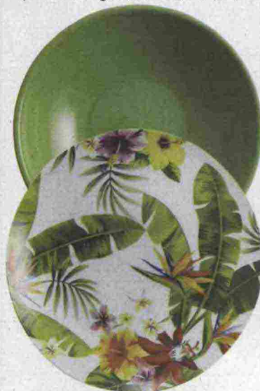
Sopra da sin., decorate la tavola con le foglie esotiche e i fiori dai colori vivaci del servizio Jungle, in porcellana e gres (Villa d'Este Home Tivoli, Set da 18 pz € 119,90); vaso foglia in vetro colorato verde, un tocco di lusso esotico per la casa (Maison du Monde, € 13,99); la musica non è mai stata così dolce con le formine in acciaio, per preparare biscotti dal sottofondo gustoso (Tamume, set 8 pz € 14,90).