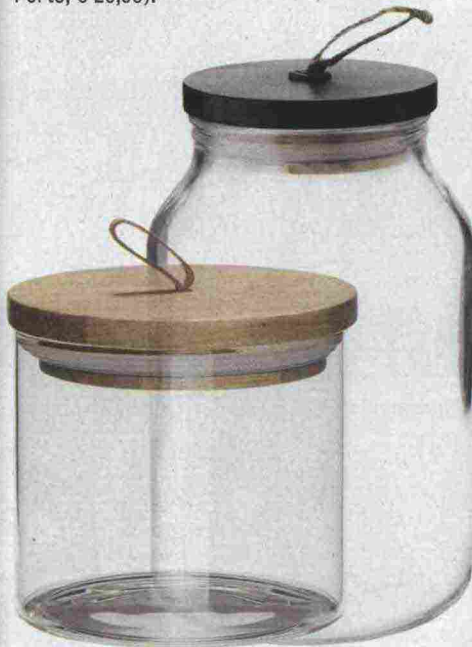
Sopra, da sin., barattolo in vetro porta cereali (Madam Stoltz, € 12,50); mini barattolo con coperchio in legno (Hübsch, € 35,00).