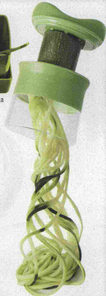
È lo strumento perfetto per preparare "spaghetti" di zucchine e di altre verdure (OXO, € 13,00 circa).